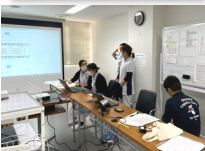
▲ 岡山県地震対策訓練