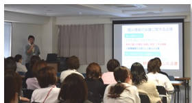
▲ 個人情報保護研修会

私たちは患者さんから治療に必要な情報を頂き、その情報に基づき日々診療に取り組んでいます。お預かりした個人情報は適切な医療を提供するために必要